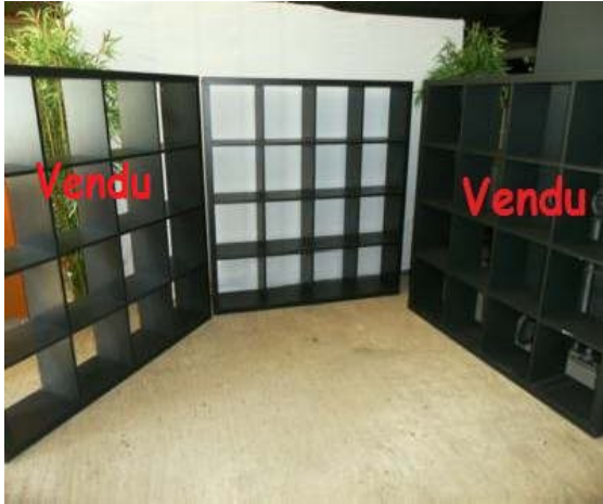
50€ (dépôt Vaas)

→ Etagère casier pour ranger livres, jeux et séparation espace (entre 40€ et 50€)